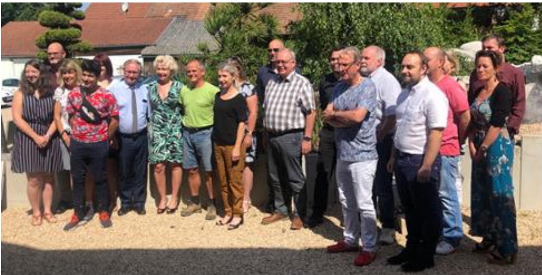
Le Bureau du CLEE