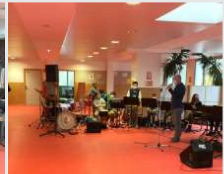
Intervention de l'école de musique de Ferrette.